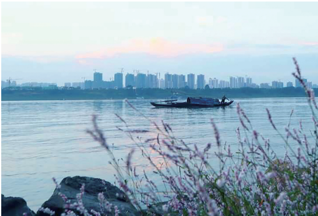
▲昨天天气晴好。傍晚，一抹残阳挂在天边，染红了一小片的江面 摄友 潭水绕花身