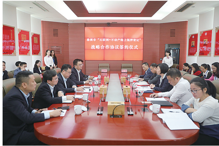
▲签约仪式现场

从11月15日开始,市民申请贷款需要办理抵押登记,在银行就可以直接申请,无须再多跑几趟不动产登记中心窗口了。