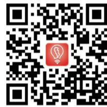
▲扫码下载“智慧株洲”