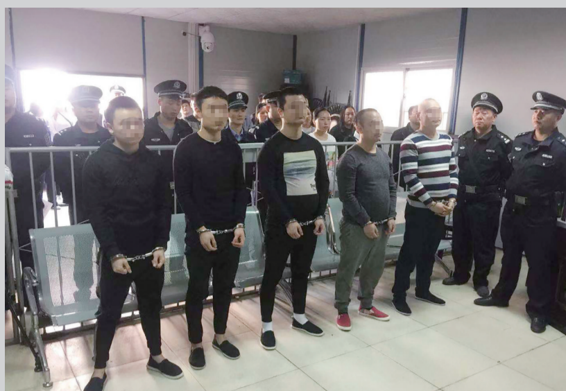
▲以暴力手段垄断片石供应的晏某等人在接受审判