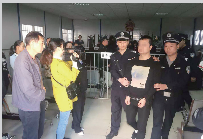
▲株洲县人民法院宣判后,嫌疑人被警方押解离场