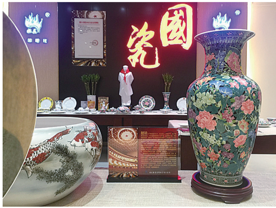
▲位于醴陵瓷谷国际展览中心的振美“国瓷”展厅