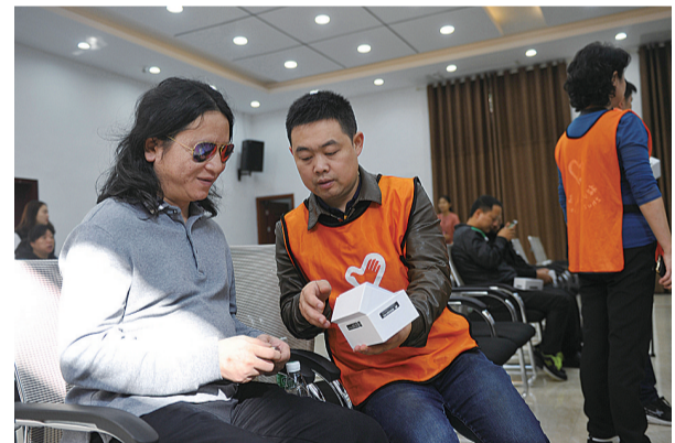
▲市图书馆为盲人朋友发放听书机

据悉,此次捐赠的听书机共收录一万多册书籍的音频资源,主要有中国古典书籍、外国名著等内容,还有超过两个小时的音乐。此外,听书机还可以拓展到100G空间内存,极大满足了盲人阅读需求,切实解决了盲人阅读难题。