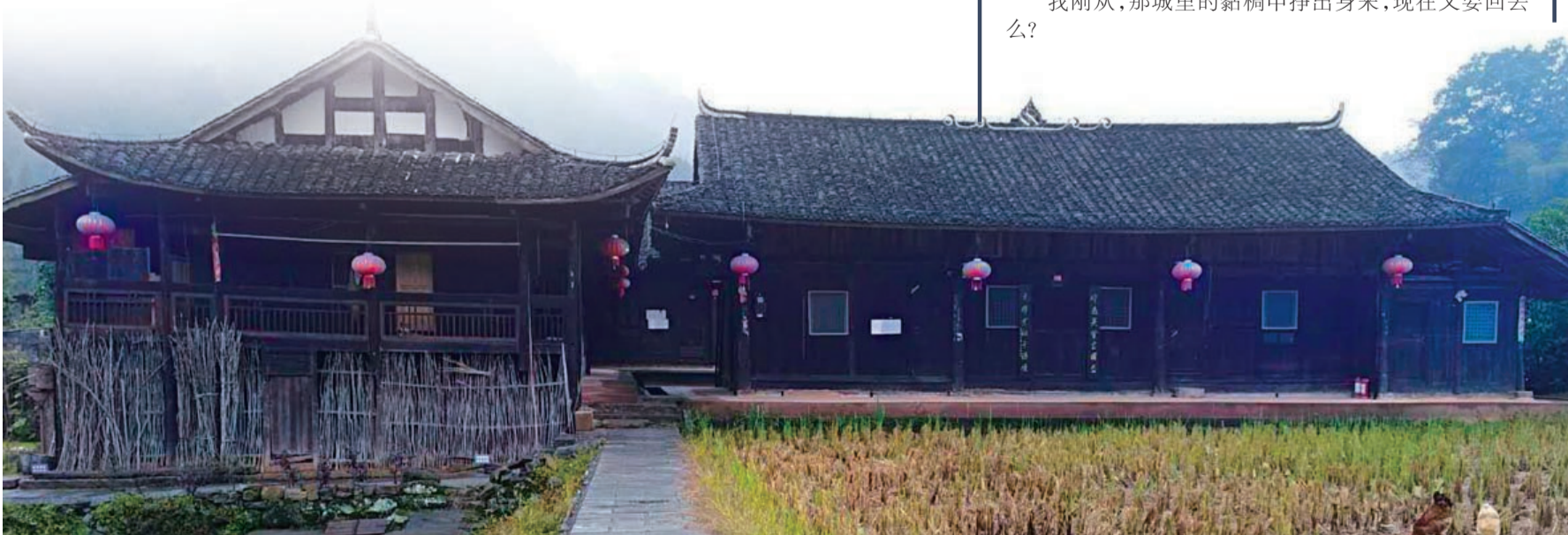
▲苏木绰景色