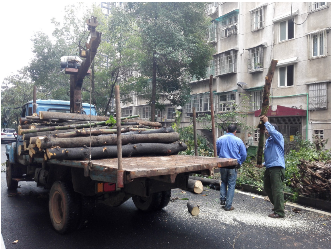
▲昨天上午,天元区某小区不少树木被砍,引起居民不满

昨天上午,家住天元区某小区的多位居民拨打晚报电话28829110反映:我们小区一大早来了一群陌生人,将绿化带上的绿化树砍掉了,很多大树长了10多年,砍掉太可惜了。大树是被谁砍掉了?砍树是否有手续?事先为何不征求业主的意见?