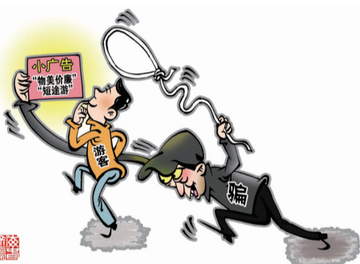
商海春 作