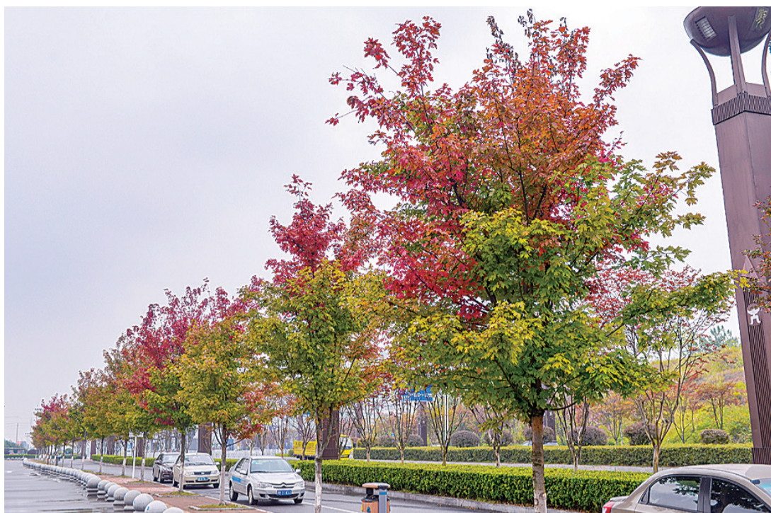
▲昨日,神农大道路边行道树上,红绿黄三色树叶混杂着,成了一道别样的风景