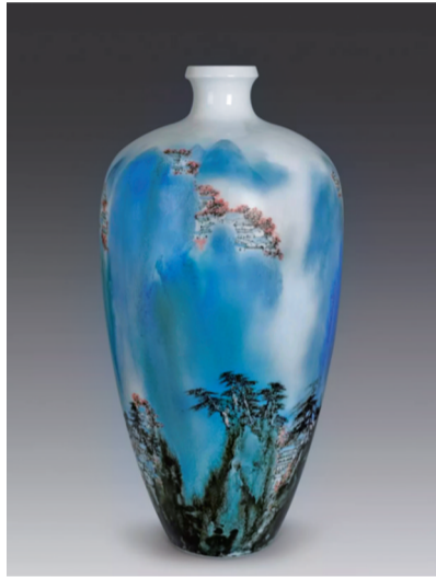
▲易龙华的陶瓷作品《潇湘早春》

第十九届中国工艺美术大师作品暨手工艺精品博览会,共吸引了来自全国28个省(市、自治区)的580余家参展商参加,展品包括金属工艺品、雕塑工艺品、珠宝玉石、陶艺、民间工艺品和工艺花画等,覆盖了工艺美术全部类别,并特设纪念改革开放40周年的“中国工艺美术大师精品特展”,为观众展现全国各地不同文化、不同风格、不同景致的工艺美术精品。凭借精湛的工艺,此次展会上,醴陵市共有三件作品获得金奖。