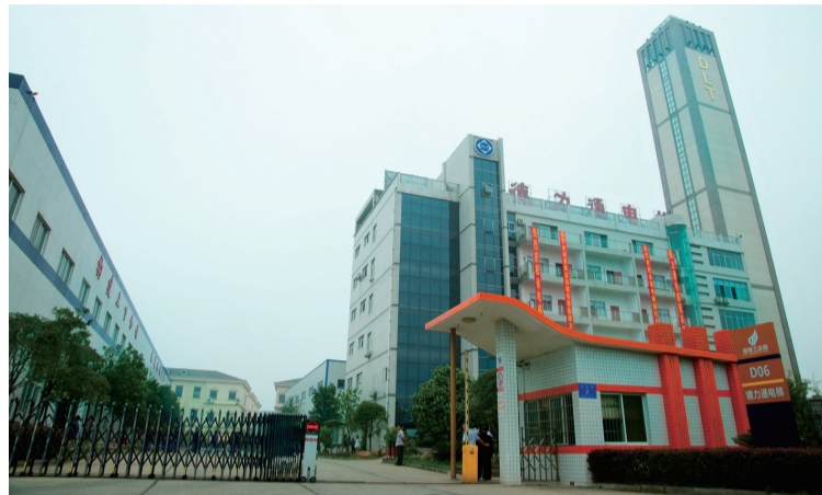
▲全省每10台国产电梯里,就有一台是“德力通”造

本报讯(记者 伍靖雯)电梯以4米每秒的速度上升,直到顶层17楼又向下,立在地上的香烟始终没有歪倒。