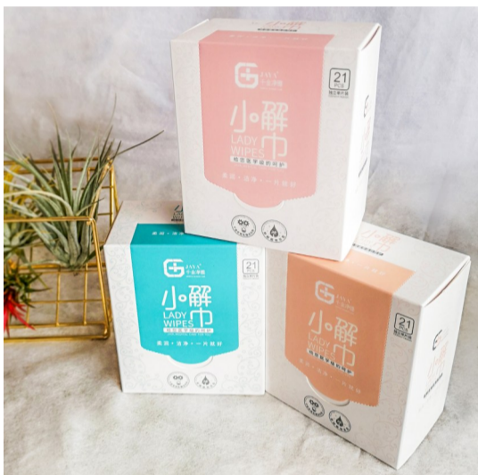
▲“千金净雅”新研发的“小解巾”