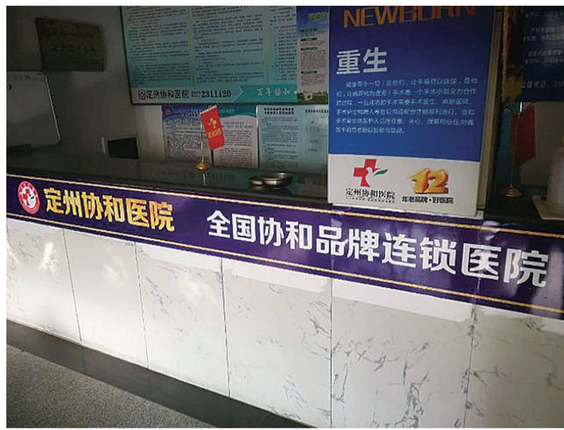
▲定州协和医院宣称该院是“全国协和品牌连锁医院”

你以为“协和医院”指的就是北京协和医院？记者通过第三方软件检索发现，全国竟有1700多家“协和医院”。“同济”“华山”等知名医院，同样长期遭遇“傍名牌”困扰；正牌就几家，但全国不认识的“亲戚”却有成百上千。