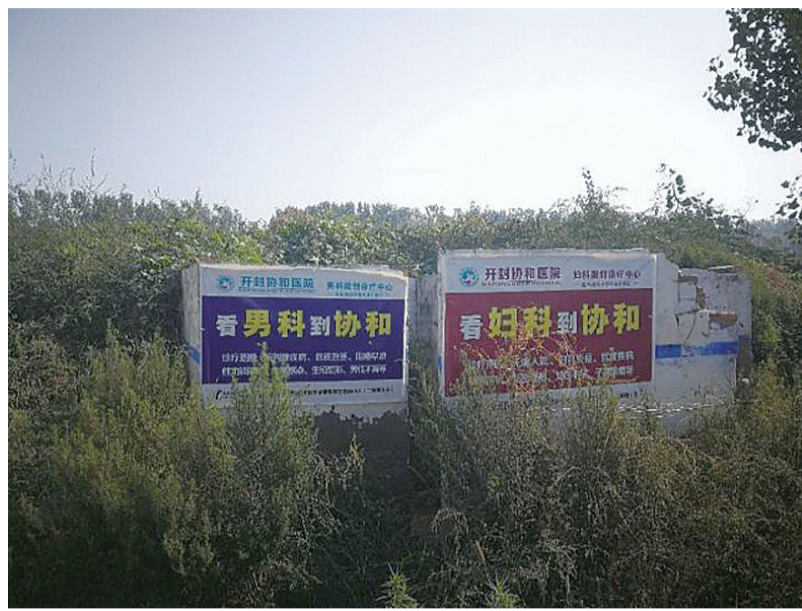
▲开封协和医院的广告牌