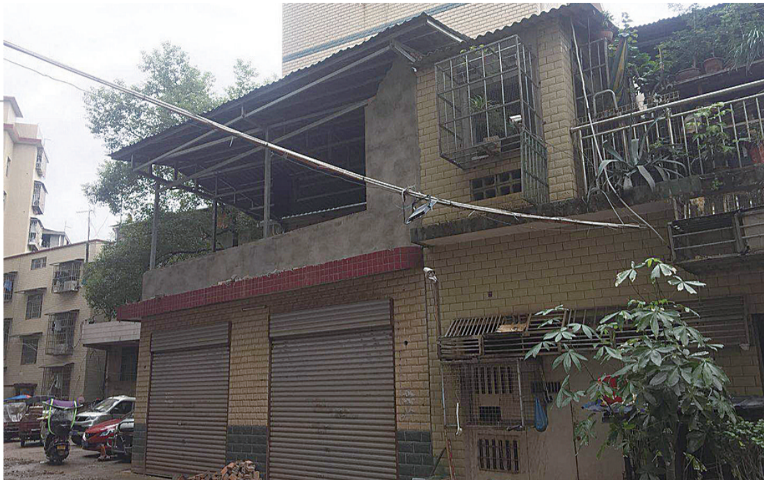
▲房子上面连建的钢架结构建筑

本报讯(记者 肖捷 通讯员 周军)“这是我工作第一年捐给母校的1万元。以后,我每年捐资1万元,奖励母校成绩优秀的学子。”近日,醴陵籍在读研究生吴婷回到母校白兔潭镇荷田中学,以个人名义设立奖学金。7年前,吴婷从荷田中学初中毕业,进入醴陵一中读高中,后以优异成绩考入上海大学攻读计算机专业。由于勤学上进,去年她被保送到浙江大学攻读硕士研究生。同时,她还幸运地成为了阿里巴巴公司的一名实习生。吴婷父母均为普通农民,家庭条件一般,但她从小有爱心。2008年的汶川地震,当时就读初一的吴婷,一次性为灾区捐出自己攒下的500元零花钱。当天的奖学金捐赠仪式上,吴婷与母校师生分享了求学路上的艰苦与欢欣。她告诉学弟学妹们,“勤能补拙”是支撑她奋斗不止的不变信念。学校负责人同时号召全体学生向她学习,奋发向上,立志成才,改变命运,学成后再回家乡,造福家乡。吴婷说,她的每一步成长离不开老师的悉心教导,在荷田中学读书的时候,她就有个梦想——将来工作了,一定要从工资中拿出一部分作为奖学金,为母校学子的腾飞助力。