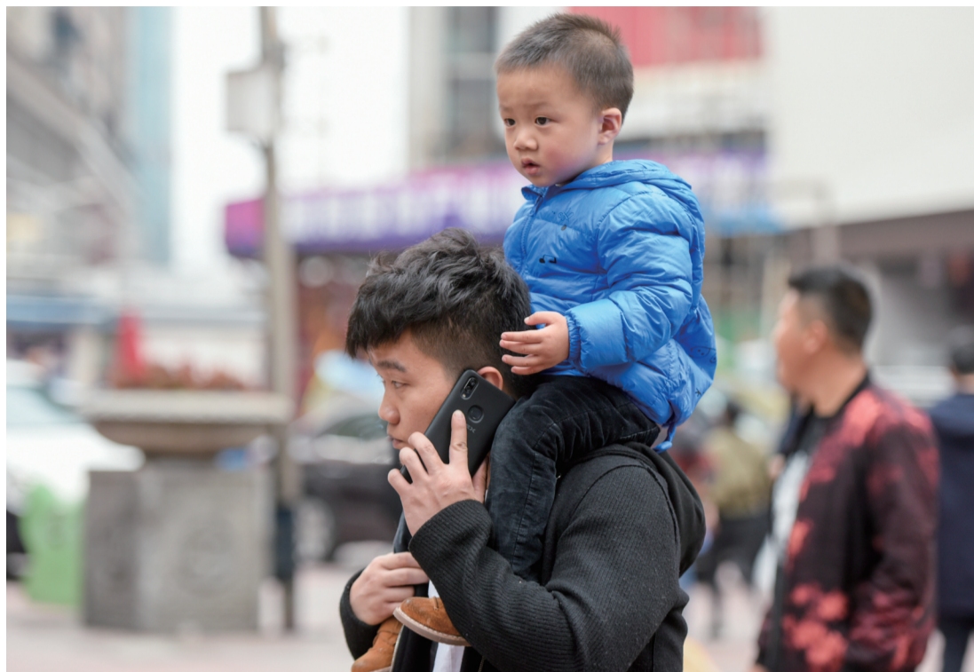
▲昨日,天气微寒,芦淞服饰城,出行的家长和孩子都穿上了厚衣服御寒

每日金句 不责人小过,不发人阴私,不念人旧恶——三者可以养德,也可以远害。——洪应明