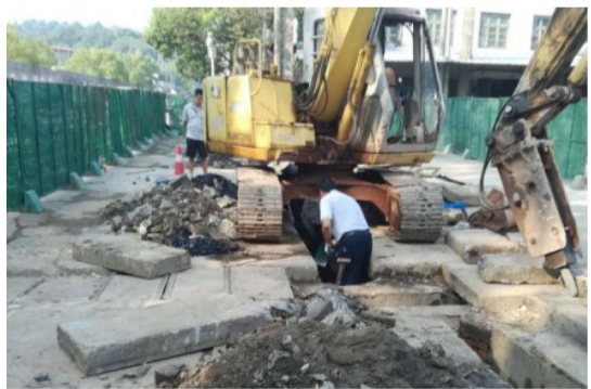
▲北沿路正在进行施工

本报讯(记者 戴凇 通讯员 罗金鹏)为畅通群众出行“最后一百米”,提升交通微循环能力,芦淞区城建局负责的第二批8条小街小巷提质改造项目被列入了今年的“民生100”工程。截至目前,鑫盛路、老化工局路、坚固西路已经完成提质改造,北沿路、大冲口社区等5条小街小巷均已启动建设,预计10月底全面完成改造内容。