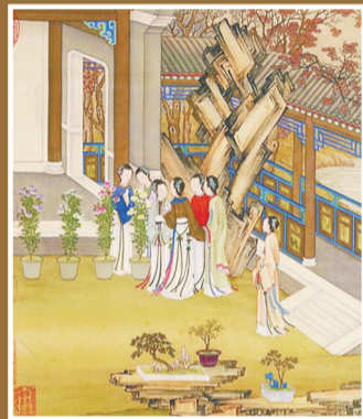
阳赏菊 ▲清陈枚绘《月曼清游图·重