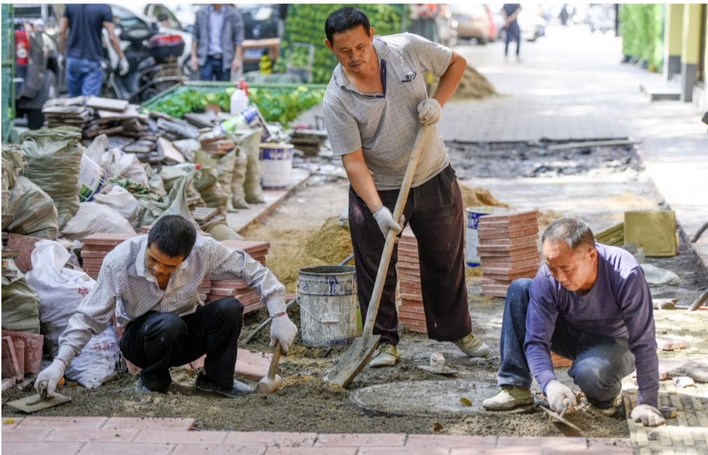
▲10月11日,在韶山东路上,停车位改造施工现场

本报讯(记者 伍靖雯 通讯员 刘阳)韶山东路沿线的违停现象突出,曾被城管部门视为“最难管”的路之一。不过,前日,好消息传来,城管部门要“放开手脚”,在此处的人行道改造增设90处停车位。