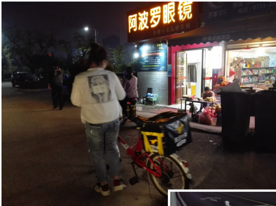
▲10日晚上,校园里小哥推着自行车送外卖