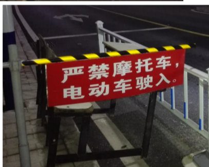
▶校园入口处,“禁摩禁电”的牌子非常醒目

这两天,陆续有市民拨打本报热线28829110反映:这两天,湖南工业大学(以下简称湖工大)禁止摩托车、电动车驶入,校园里凡是发现电动车、摩托车,保卫人员并