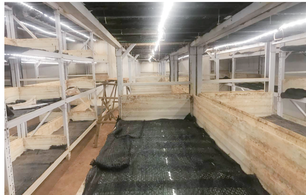
▲由于空调问题,王先生的种植场一直处于停工状态