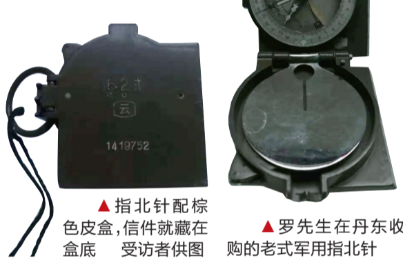
▲指北针配棕色皮盒,信件就藏在盒底 受访者供图 ▲罗先生在丹东收购的老式军用指北针 受访者供图

本报讯(记者 肖蓉)十多年前,市民罗先生买了一个旧军用指北针,直到最近,他偶然发现装指北针的皮盒底部竟然有一封47年前的信件。信件是一位名叫白爱华的人写给王继的,信中还提到了另一人孟玉贵。罗先生称,这三个人好像是同学关系,他因此希望能把信件归还给原主,留住这份难得的情谊。