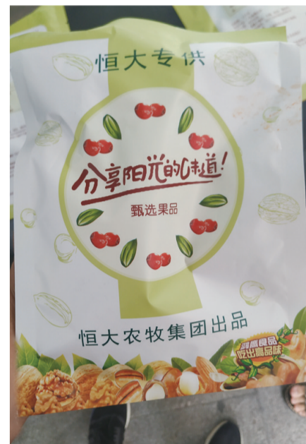
▲包装袋显示为“恒大专供”