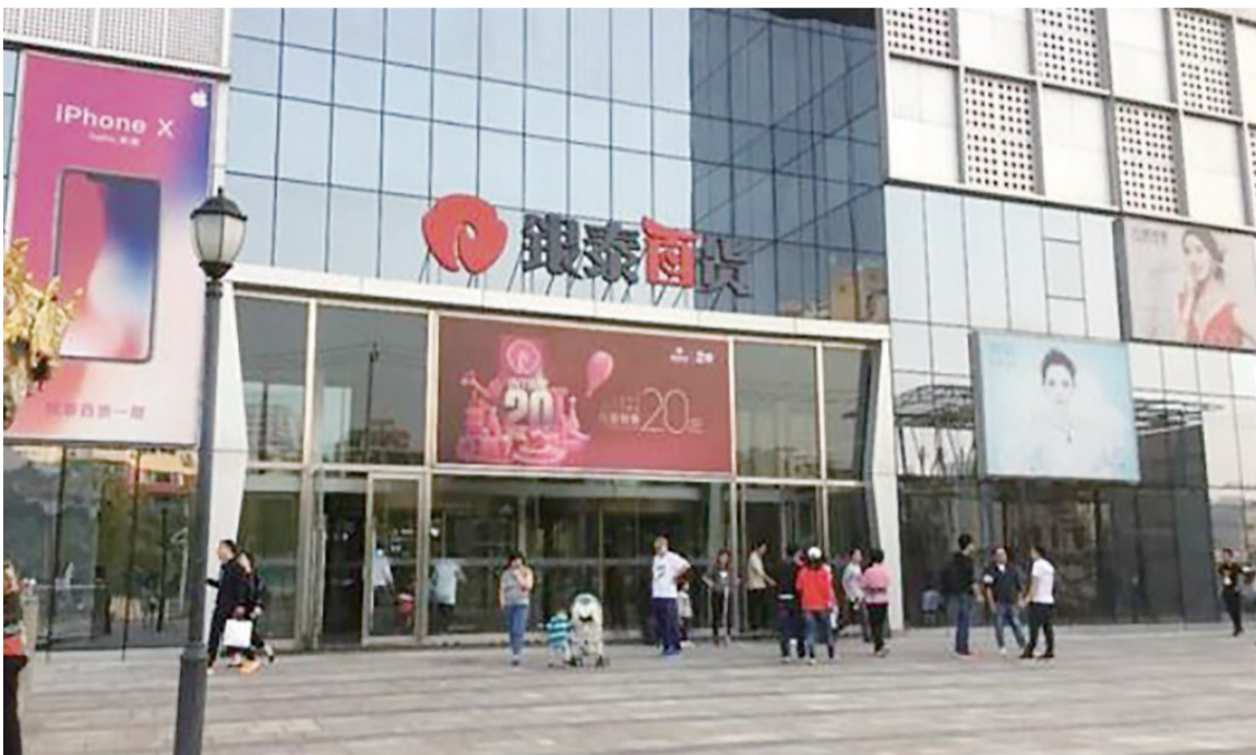
▲事发地银泰百货大红门店门口

据介绍，事主随后向丰台分局大红门派出所电话报警，民警迅速处警，对事主进行访问并同步开展查找涉案人员、询问证人、调取监控录像等工作。