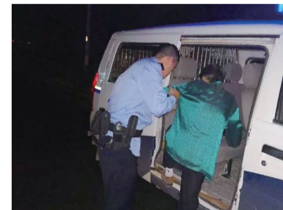
▲民警开车带老人寻找家人

该知情人称,老人有老年痴呆症,是其一朋友的妈妈,经常走失,家里正为老人走失焦急不已,到处寻找。