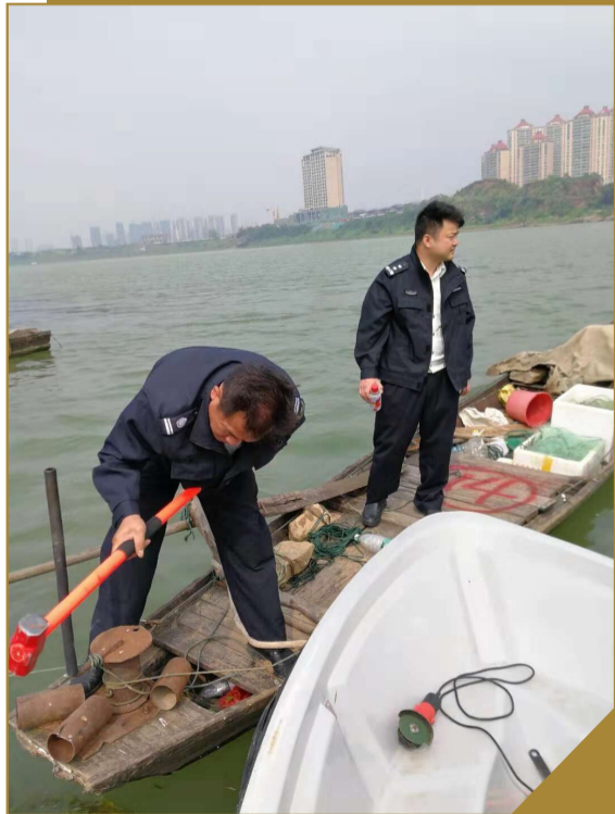
▲执法人员拆除船上非法捕捞工具