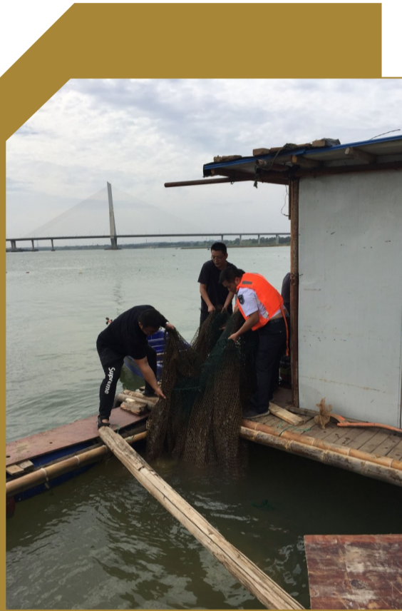
▲执法人员清理湘江水面上的围网

据初步统计,今年以来,渔政部门已收缴背包电鱼设备50余套,发现电鱼船5艘,其中4艘已移交公安部门处理。