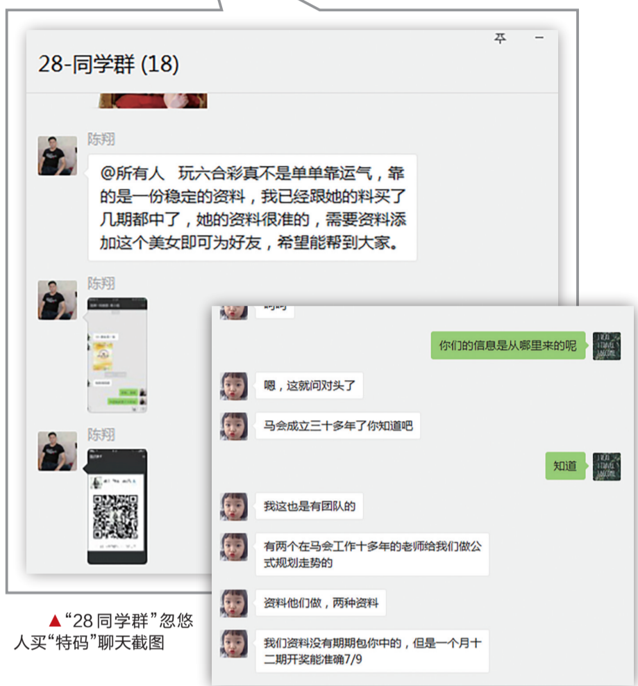
▲“28同学群”忽悠人买“特码”聊天截图