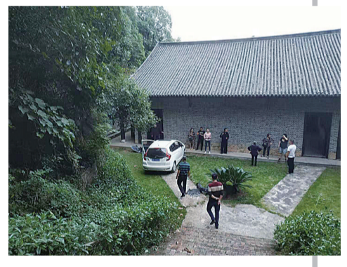
▲游客在围观