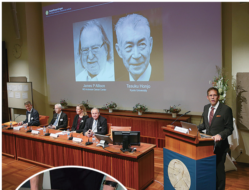
▲昨日,诺贝尔生理学或医学奖评选委员会新闻发布会现场

是什么变故使得今年的诺贝尔奖“6减1”?少了文学奖,诺贝尔奖还有哪些精彩看点?诺贝尔奖又有怎样的前世今生,经历了哪些变迁?