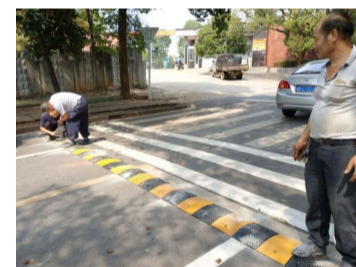
▲工人正在安装减速带