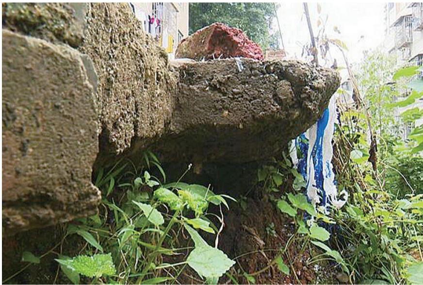
▲护坡上方的水泥路受雨水冲刷,变成半悬空状态