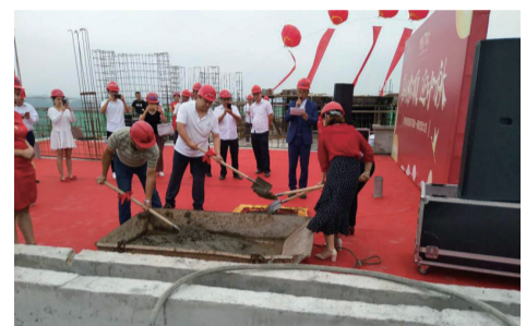
▲型格7都会封顶仪式现场

2018年9月21日上午,型格7都会一期(2#、3#栋)封顶仪式顺利举行,型格7都会项目领导与业主代表一起填下了项目一期的最后一把水泥。