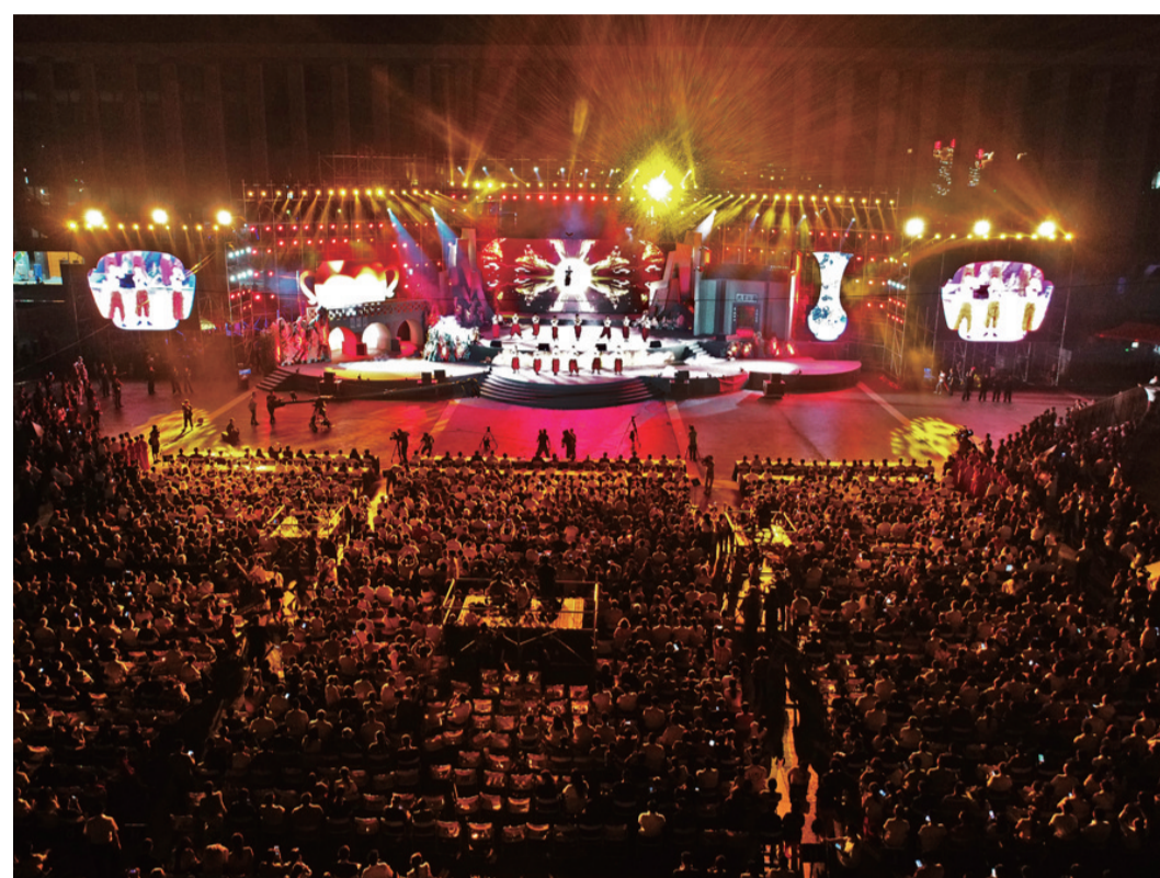
▲2018年中国湖南国际旅游节暨中国(醴陵)国际陶瓷产业博览会开幕式“湖南瓷旅之夜”现场