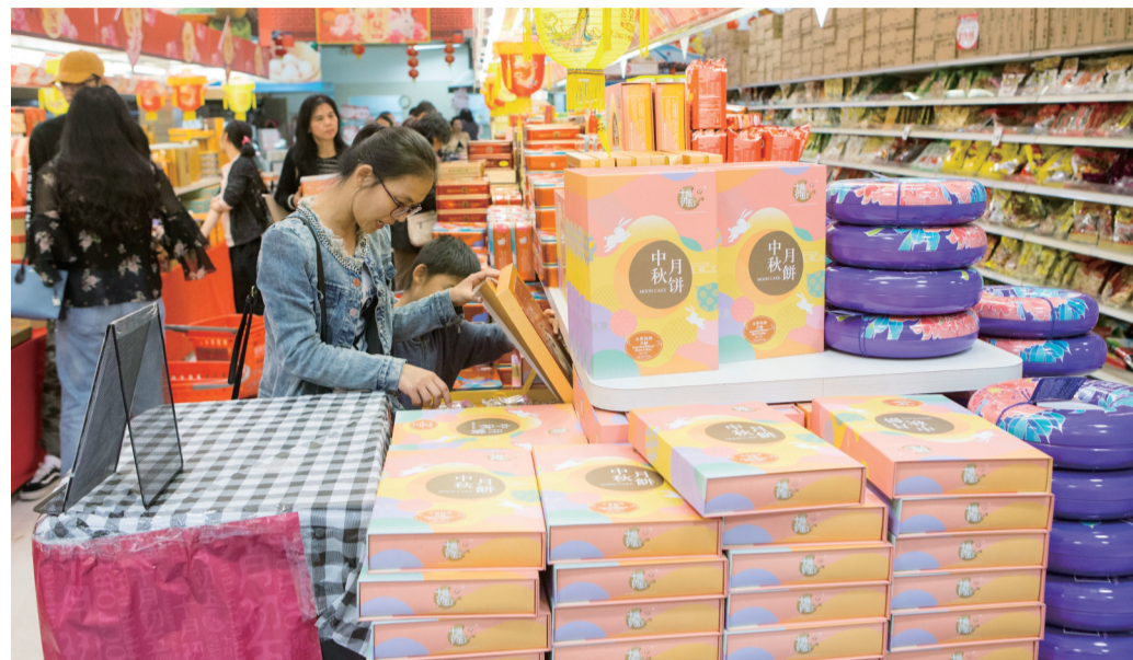
▲9月23日，顾客在超市挑选月饼