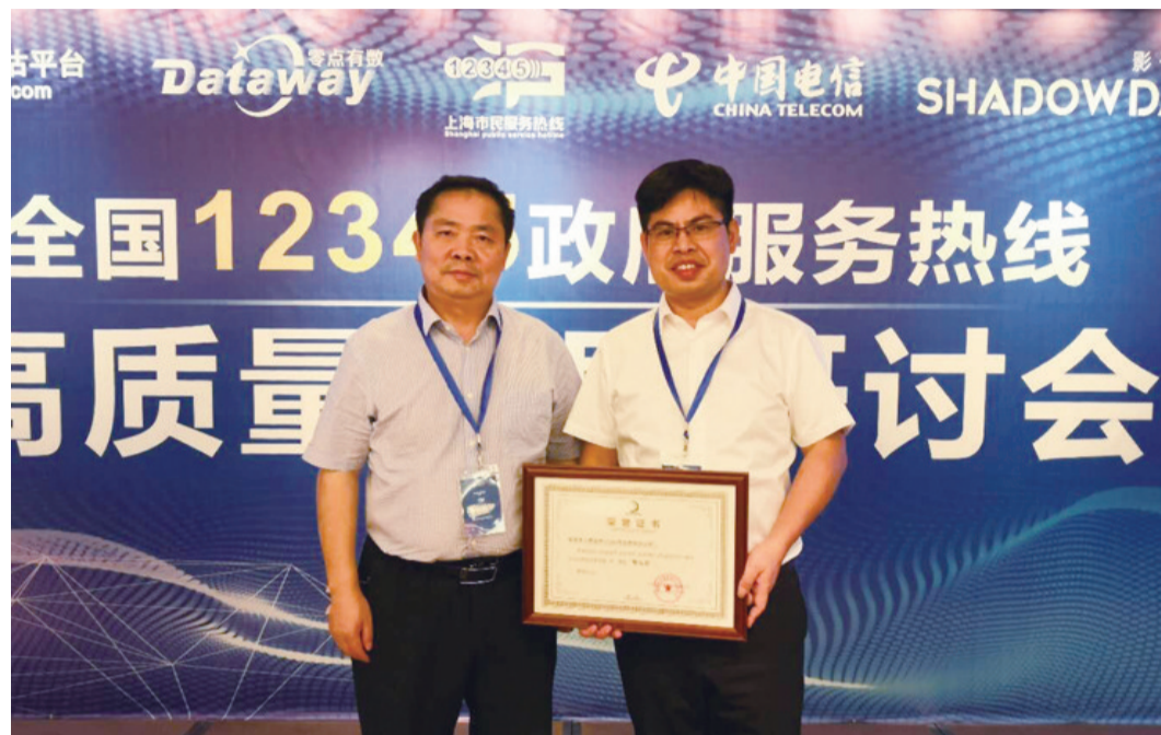
▲株洲市长热线工作人员代表(右)领奖后现场留影

本报讯(记者 陈驰)上周,在上海召开的第二届全国12345政府服务热线高质量研讨会上,我市12345市长热线在全国335个城市中脱颖而出,荣获“骏马奖”,成为湖南省获奖的4个城市之一。