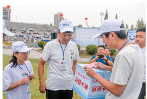
▲河长制知识答题运动会大学生参加趣味答题

去年以来,全市上下按照“见河长、见行动、见成效”安排部署,推进河长制落实见效。全市共设立市、县、乡、村四级河长2054人,竖立各级河长公示牌2186块,实现了所有河流、水库四级河长全覆盖。围绕“僵尸船整治”、非法采砂整治、河道保洁、排污口整治、“清四乱”等重点工作,开展了一系列专项整治行动,许多涉水问题得到有效解决。目前,一江两水水质持续变好,霞湾、洙水草市镇、涪江入河口三个国控断面水质全面达标,19个省级水功能区水质均达到优良。