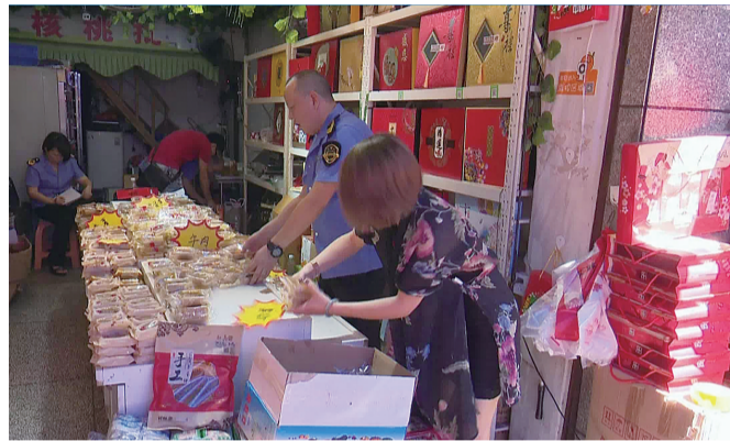
▲执法人员在作坊内检查

本报讯(记者 陈驰)中秋佳节将至,月饼成了近段时间最为畅销的食品之一。然而前两天,有市民陆续向市长热线反映,他们购买的月饼,既没有生产日期、保质期,也没有厂名、厂址,这样的月饼他们不敢吃,希望相关部门能够调查。