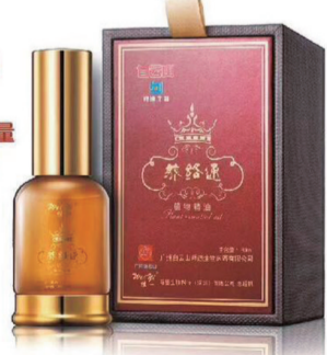
本产品由中国平安承保1000万

天然本草凝华 汲天地能量 50味名贵中药 循古方精纯萃取 超微原液分子 凝聚赋活热能 透皮瞬间深层沁入 释放精粹能量 高密喷雾型设计 精准控制取量