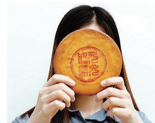
从15CM到18CM 没有最大 只有更大

每年这个时间节点,便是挑选月饼的高峰期。形形色色的月饼,味道各异,形态也是各不相同。一到中秋节,朋友圈都会被各种各样的月饼花式刷屏。除了传统月饼外,近年来,网红月饼一个接一个变着花样吸引着消费者的目光,大家的视线也逐渐被它新奇的外表和独特的口感所吸引。