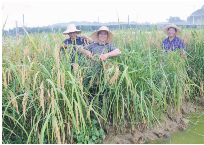
▲雷打石镇凤凰山村的巨型水稻迎来了收割季

本报讯(记者 何春林)19日,天元区雷打石镇凤凰山村的巨型水稻迎来了收割季了,村民开始收割雷打石镇凤凰山村的30亩纯种植的巨型稻,还有20亩立体种养的巨型稻等着收割,预计需要4天时间才能全部收割完毕。下个月,这些巨型稻将上市销售。