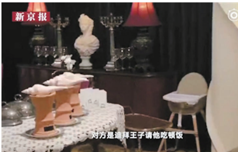
▲上海“西郊5号”餐厅内景