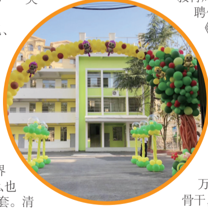
▲原本基础设施陈旧的新明学校被修缮一新