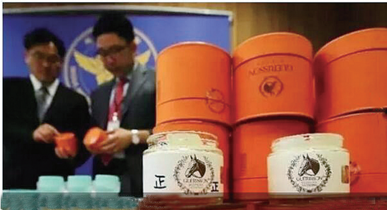
▲工作人员正在对比正品和假货 资料图

记者近期调查发现，化妆品制假售假已形成完整的“黑色产业链”，分工明确，设备齐全，专业化程度很高，其中细分出的“假货生产商”“包材提供商”“渠道批发商”等环节，每一环都利润惊人。专家表示，从进货渠道、产品规格、合格证等各方面保障化妆品的产品质量，对于产品质量不合格、进货渠道不正规的商家要坚决取缔。