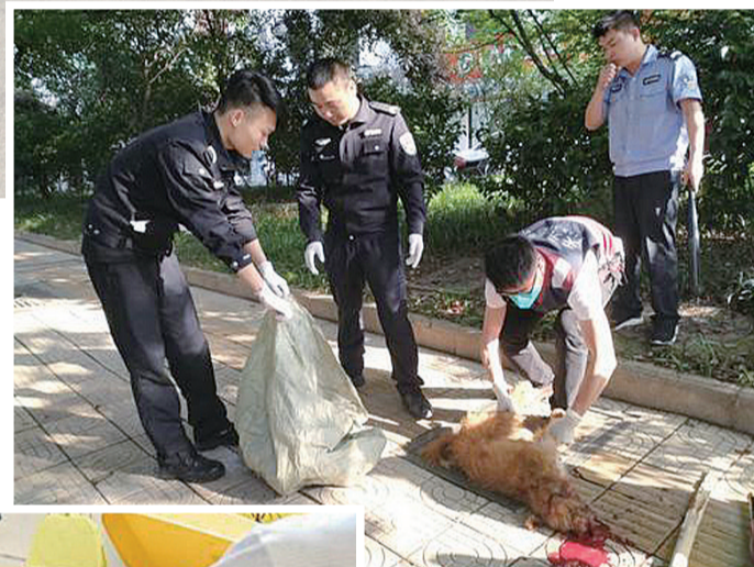
▲今年4月,天元区中建御山和苑小区附近,多名市民被同一条狗咬伤。民警最终发现了这条狗的踪迹,将其扑杀 (资料图)