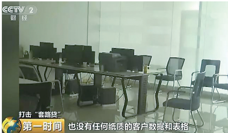
第一时间 也没有任何纸质的客户数据和表格

经过摸排梳理,在确定诈骗“套路贷”之后,90多位民警组成多个抓捕组,对涉案的10家贷款公司进行了统一收网,共抓捕涉案人员127人。