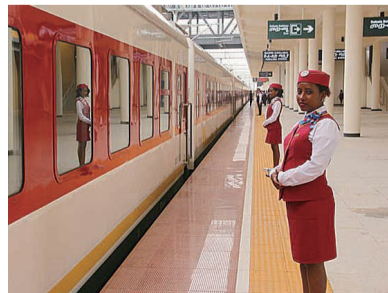
▲亚吉铁路火车站 资料图