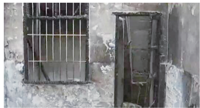
▲火灾现场

本报讯(记者 贺天鸿)男子与前妻起争执后吸毒，丢烟头引火烧毁房屋后逃离。近日，天元区检察院以涉嫌放火罪依法批准逮捕犯罪嫌疑人沈某。