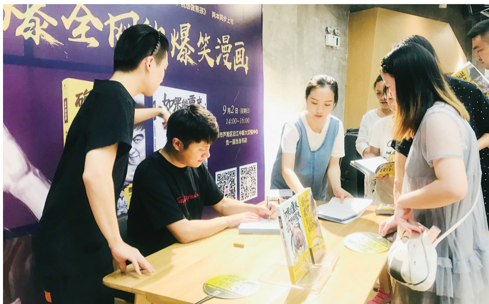
▲昨天，大汉悦中心当当阅界，左手韩新书签售现场