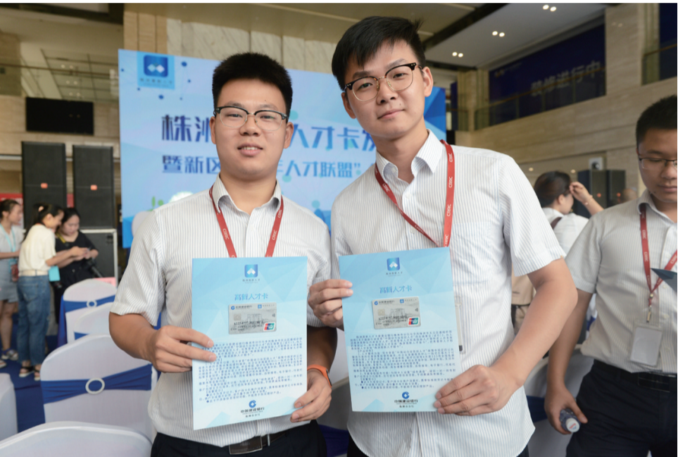
▲优秀青年人才领到高新人才卡

本报讯(记者 伍靖雯 通讯员 徐洋 殷慧敏)昨日,株洲高新人才卡发放暨新区“青年人才联盟”揭牌仪式举行,200余名青年才俊拿到首批高新人才卡。