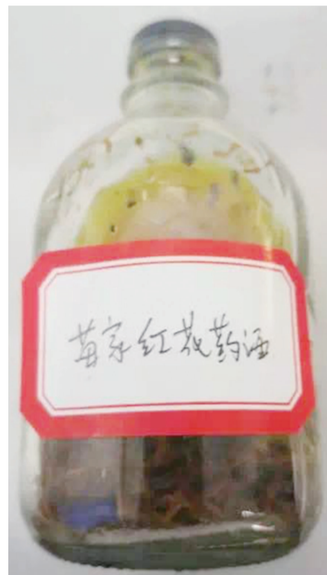
▲执法人员查获的“苗家红花药酒”

市食药监局联合公安机关迅速对该摊贩团伙进行控制,现场抓获犯罪嫌疑人5名,缴获用于作案的疑似假药酒、药丸等若干。经调查了解,犯罪嫌疑人销售的“苗家红花药酒”产品系由白酒、酱油、普通中药材、树根混合而成;标识“苗家断根药丸”的产品由乌鸡白凤丸捏小之后裹上姜黄粉末制成。根据《中华人民共和国药品管理法》相关规定,上述涉案产品均按假药论处。目前案件正在进一步调查处理中。