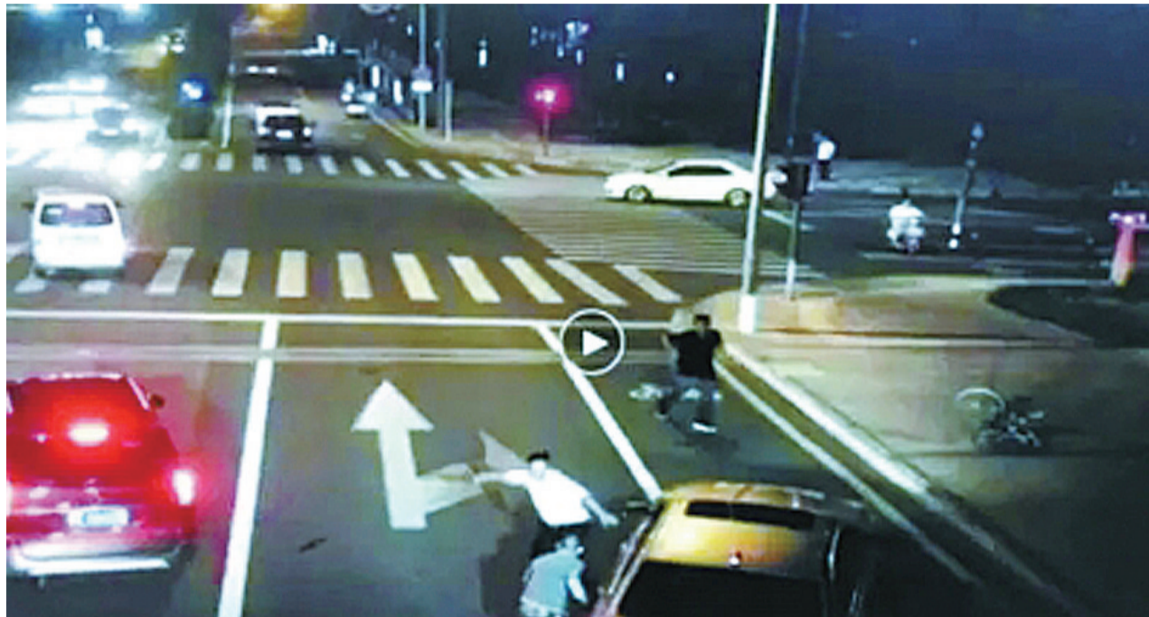
▲案发现场(视频截图)

记者注意到,对于犯罪嫌疑人是正当防卫还是防卫过当,是否应承担刑事责任,目前司法界和法学界持有不同观点。