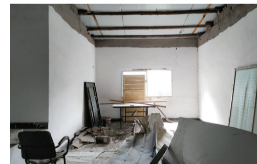
▲二单元某户加盖的房屋,地上堆放着建材,施工还未完成