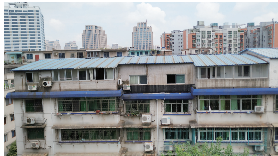
▲原天元区环保局大院住宅楼,楼顶整层被加盖房屋

昨日,有市民拨打晚报新闻热线28829110举报:天元区原机关大院内的住宅楼楼顶有违法建筑,和晚报报道的华茂商厦违建情况相似,业主在楼顶违法建设的建筑物占据了整层楼顶,还用于出租,并且违法建设的业主还是公职人员。