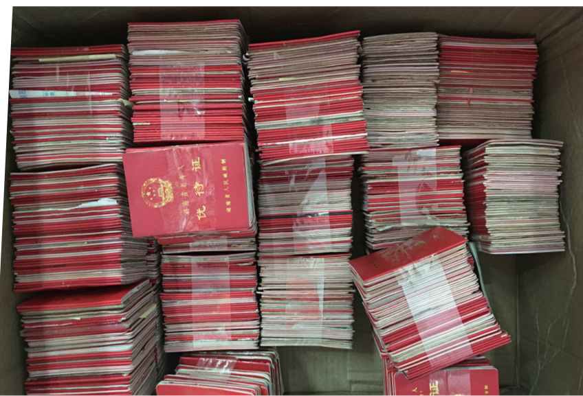
▲被没收的假证

本报讯(记者 戴凇 通讯员 殷滋)用他人的老年人优待证乘公交,当证件被驾驶员没收后,乘客竟直接阻止驾驶员开车。类似事件,今年我市已发生多起。记者昨日从市公交总公司了解到,今年以来,公交部门已没收各类假证或违规使用的证件达1100余本。