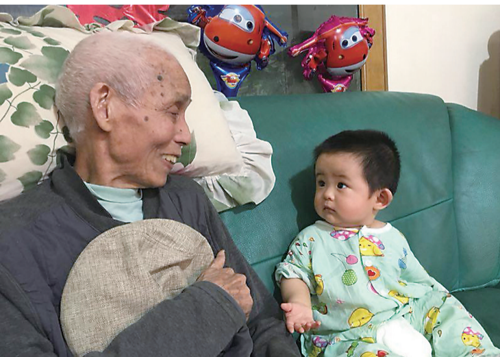
图为我家90岁的外公和9个月的小宝初次相逢的场景。他们俩现在都住在小宝的外婆家,生活起居都由外婆悉心照顾,彼此不需要言语,每个眼神都充满爱意。家和万事兴,家有一老一小如获至宝,愿老人健康长寿,宝宝快乐成长!