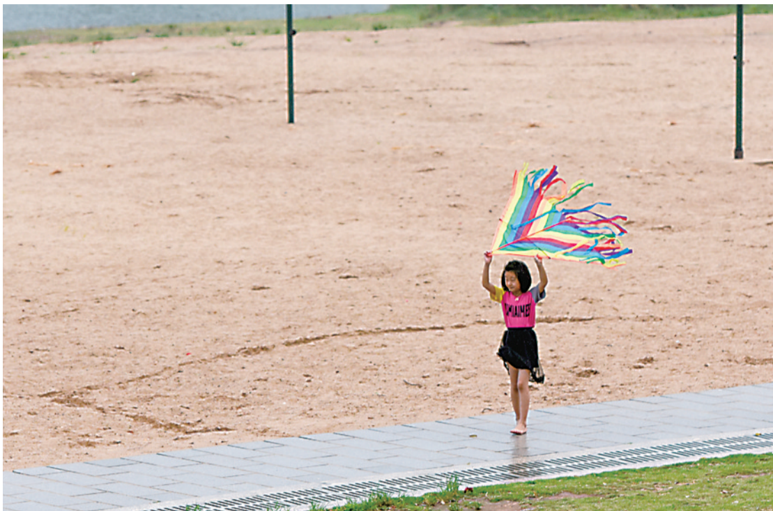
▲昨日时晴时雨,河西风光带上,一位孩子用风筝遮雨