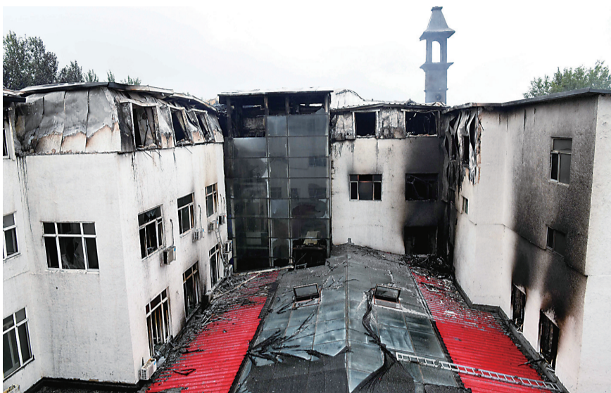
▲这是8月25日拍摄的酒店发生火灾的客房楼体