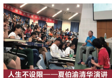
人生不设限——夏伯渝清华演讲

云健康项目组力邀夏伯渝老师莅临株洲,将在株洲地区举办“不忘初心 勇攀巅峰”登顶珠峰事迹报告会。本次报告会关注老年人的身心健康,将以老年人的视角,以同龄人的身份,来诠释勇气与梦想,助力中老年朋友活出全新的自己,不留遗憾,实现自己的“珠峰梦想”!