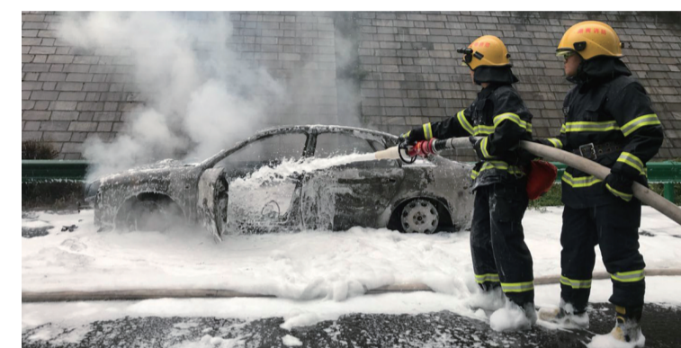
▲小车自燃,消防员正在扑救

本报讯(记者 刘玺)8月17日下午5时20分许,京港澳高速1579公里往南方向,一辆衡阳牌照的奥迪轿车突然自燃,火势随后被栗雨消防中队官兵扑灭,自燃事件未造成人员伤亡。