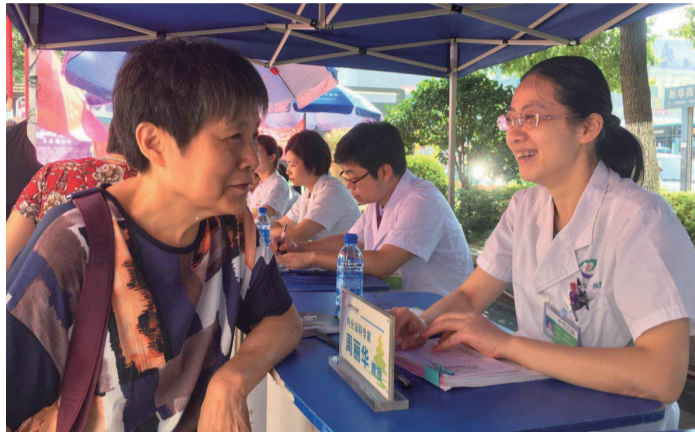
▲义诊活动现场,医生为市民答疑解惑

“‘中国医师节’的设立,对于加强医师职业规范,加强行业自律,更好地改善医患关系,具有积极作用。”市卫计委医政科科长沈刃介绍。