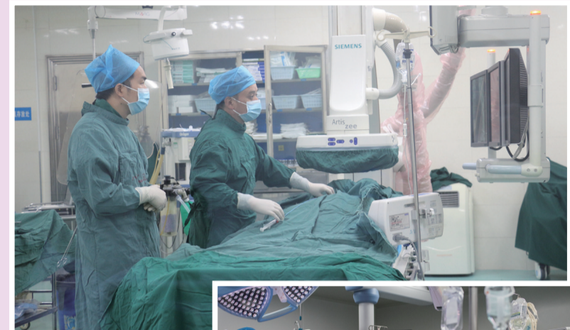
▲动脉导管未闭手术 ▲胸腔镜心脏外科手术

在株洲市荷塘区茨菇塘恺德路的路上,120急救车的铃声就是警报,北大医疗株洲恺德心血管病医院的医生们像战士们一样投入到生命的保卫战。记者用文字和镜头记录下这家三级心血管专科医院紧张又平凡的一天。