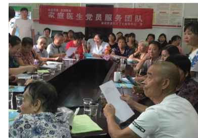
▲党员服务团队在戴家岭村进行现场家庭医生签约

家庭医生签约服务模式是以居民健康服务为主要内容的一种新型服务模式,旨在推广“小病进社区,大病进医院”的就诊理念,即签订一份协议,做一次免费检测,建立一份健康档案,开通一条绿色通道,做好老百姓的健康管家。(通讯员 左彩惠)