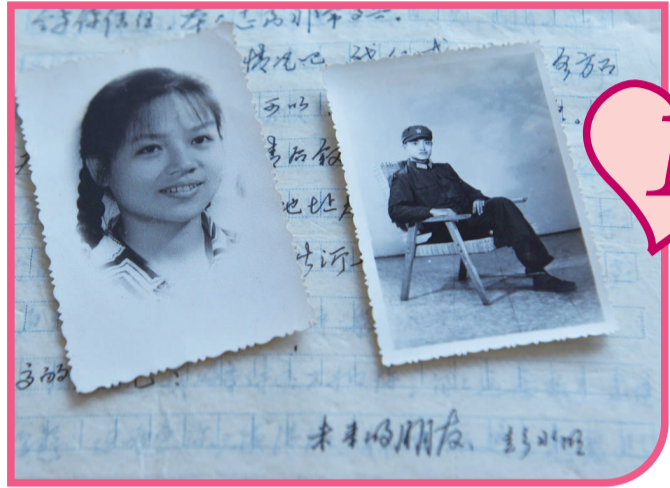
▲三十多年前的帅哥靓妹和情书