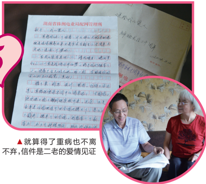
▲就算得了重病也不离不弃,信件是二老的爱情见证