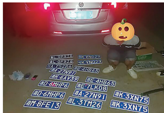
▲在嫌疑人车里查获的假牌照

本报讯(记者 肖蓉 通讯员 谢琛皓)近日,茶陵一位男子轻信“大师”可以消灾去难,结果被人骗走3000元现金和金银首饰。