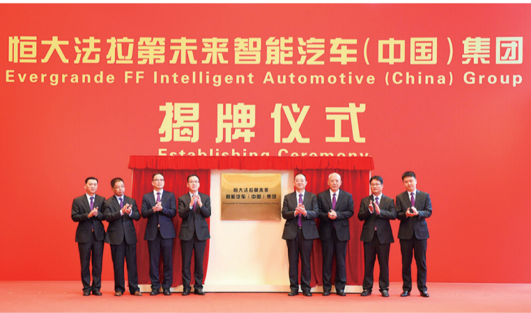
▲恒大法拉第未来智能汽车(中国)集团揭牌仪式现场

目前世界上已有不少国家出台了禁售燃油车的时间表,发展新能源汽车是大势所趋。未来十年甚至更长的时期内,新能源汽车的产销都将保持高速增长,10—20年后新能源汽车的年销量可达几千万辆,甚至上亿辆,前景非常广阔。